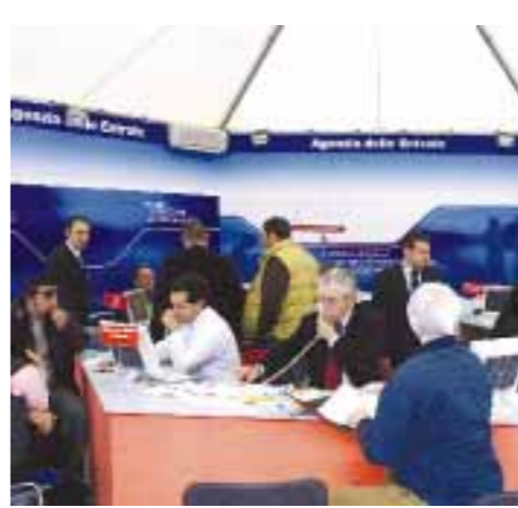
SERVIZI TELEMATICI DELL'AGENZIA DELLE ENTRATE

L'invio telematico per l'Unico 2004, tramite gli uffici dell'agenzia, è consentito per circa sei mesi fino al prossimo 2 novembre.