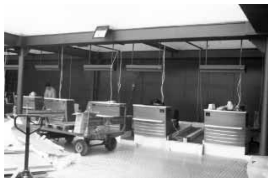
A SINISTRA I LAVORI DELLA NUOVA AEROSTAZIONE ORMAI IN FASE AVANZATA; SOPRA IL PADIGLIONE PROVVISORIO PARTENZE CON NOVE BANCHI CHECK-IN, IN FUNZIONE A GIORNI, PER FRONTEGGIARE IL PREVISTO INCREMENTO DEL TRAFFICO ESTIVO