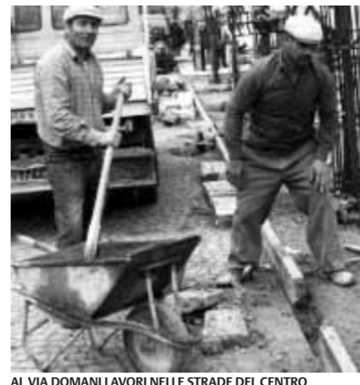
AL VIA DOMANI LAVORI NELLE STRADE DEL CENTRO