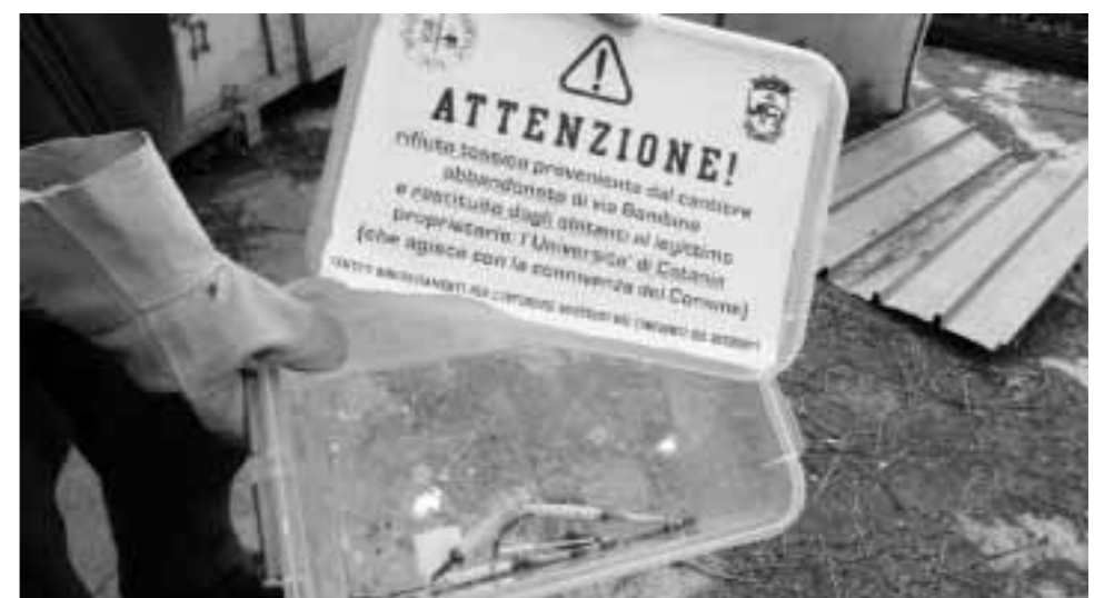
LE SIRINGHE ABBANDONATE RACCOLTE IERI NEL CANTIERE DI VIA BAMBINO

«Eppure - sostengono i residenti - dopo il danno di cinque anni di abbandono e degrado, si aggiunge la beffa di non potere vedere realizzate queste proposte, sebbene l'Amministrazione le avesse reputate fattibili. Non ci stancheremo di denunciare questo totale abbandono, che si somma all'abbandono di tutto il resto del quartiere, unico senza una bambinopoli, dove i bambini sono costretti a giocare per strada, dove il giardino pubblico dei Benedettini è ancora abbandonato, dove non esiste un asilo nido né un piano di sostegno alle famiglie per la casa».